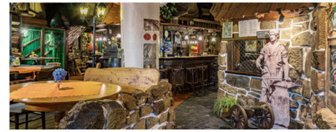
Location für die Abendveranstaltung: „Suhler Waffenschmied“ (Mehr Infos: hier)

Im September 2024 findet unsere 20. Fachtagung zum Thema „Sicherheit in Tunnelanlagen“ in Suhl (Thüringer Wald) statt. In dieser regelmäßigen stattfindenden Veranstaltungsreihe werden jährlich neue und aktuelle Themen aus dem Bereich der Sicherheit für Tunnelanlagen präsentiert. Unter dem Motto „Experten im Dialog“ können Erfahrungen und Best-Practice-Lösungen ausgetauscht und diskutiert werden. Diese Veranstaltung dient außerdem als Fortbildungsveranstaltung für Sicherheitsbeauftragte bzw. Tunnelmanager für Tunnelanlagen sowie für alle Personen, welche sich mit dem Thema Sicherheit in Tunnelanlagen befassen.