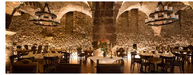
Location für die Abendveranstaltung: „Gewölbekeller“ in Trier

Im September 2023 findet unsere 19. Fachtagung zum Thema „Sicherheit in Tunnelanlagen“ in Trier statt. In dieser regelmäßig stattfindenden Veranstaltungsreihe werden jährlich neue und aktuelle Themen aus dem Bereich der Sicherheit für Tunnelanlagen präsentiert. Unter dem Motto „Experten im Dialog“ können Erfahrungen und Best-Practice-Lösungen ausgetauscht und diskutiert werden. Diese Veranstaltung dient außerdem als Fortbildungsveranstaltung für Sicherheitsbeauftragte bzw. Tunnelmanager für Tunnelanlagen sowie alle Personen, welche sich mit dem Thema Sicherheit in Tunnelanlagen befassen.